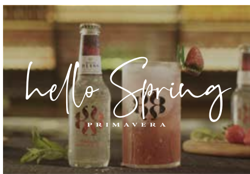
"BOHEMIAN COLLINS" BY OSCAR SOLANA

Apoyados por "The Crew" (grupo de bartenders que colabora con Coca-Cola) que ahora presenta "Combinados con Historia" (un combinado para diferentes momentos del año)