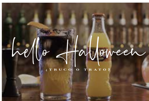
"MURCIÉLAGO" BY MANU ITURREGI