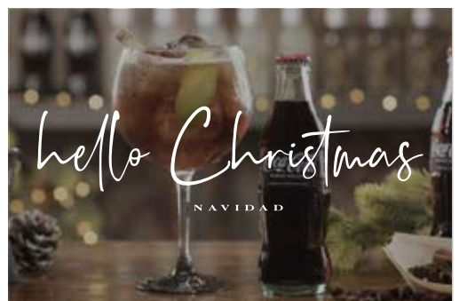
"XMAS LIBRE" BY JUAN VALLS